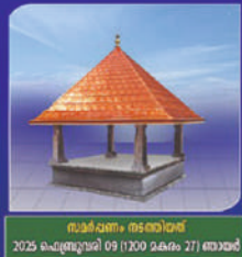
സാർവ്വം നടരവർ 2025 ഫെബ്രുവരി 09 (1200 മകരം 27) ബുധൻ