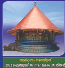
സാർവ്വം നടരവർ 2022 ഫെബ്രുവരി 07 (1197 മകരം 24) തിങ്കൾ